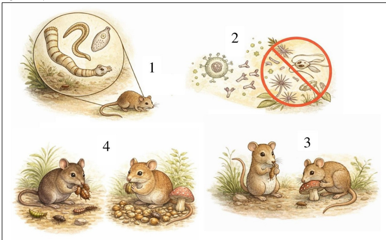
Influencia potencial de los parásitos en la alimentación y diversificación de roedores: (1) Los helmintos colonizan el sistema digestivo del hospedero; (2) inducen respuestas inmunológicas y cambios en la microbiota gastrointestinal, favoreciendo la producción de anticuerpos, el desplazamiento de otros endoparásitos y modificaciones fisiológicas; (3) estos cambios pueden alterar los hábitos alimenticios entre individuos de una población; y (4) a largo plazo, podrían contribuir a procesos de diversificación asociados con diferencias en la dieta.

El intercambio de parásitos entre individuos también es fundamental para comprender su dinámica evolutiva. En comunidades de roedores y ectoparásitos como las pulgas, las madrigueras desempeñan un papel clave. En regiones desérticas, donde las madrigueras suelen ser poco profundas y existe mayor contacto entre individuos, el intercambio de parásitos como las pulgas ocurre con más frecuencia. Esto incrementa el flujo parasitario entre hospederos y potencialmente acelera los procesos de diversificación. Por el contrario, en regiones frías donde las madrigueras son más profundas y el contacto entre individuos es menor, este flujo de parásitos disminuye y la diversificación podría ocurrir de manera más lenta.